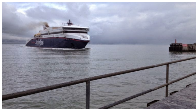
Hirtshals Havn, 22-01-2015

Videre til Hirtshals, hvor vi – efter nogen tids søgen, endelig fandt 3 Toplærker , hvoraf den ene sad og sang på taget af Netto!