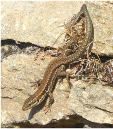
Podarcis muralis , mâle subadulte