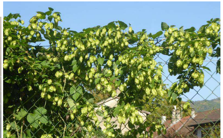
Houblon Humulus lupulus