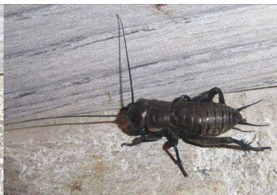
Grillon des champs Gryllus campestris , juvénile