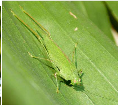
Phaneoptera nana ?