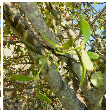
Gui Viscum album album