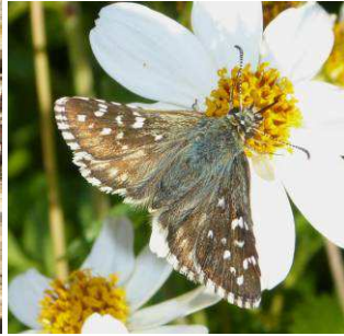
Pyrgus malvae ?