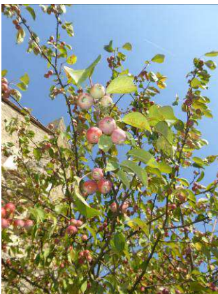
Pommier à feuilles de prunier Malus prunifolia