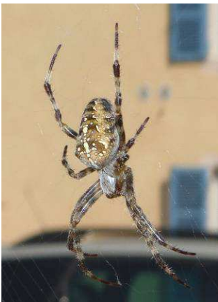
Épeire diadème Araneus diadematus