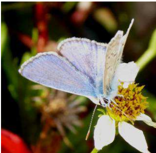
Polyommatus icarus , mâle et femelle