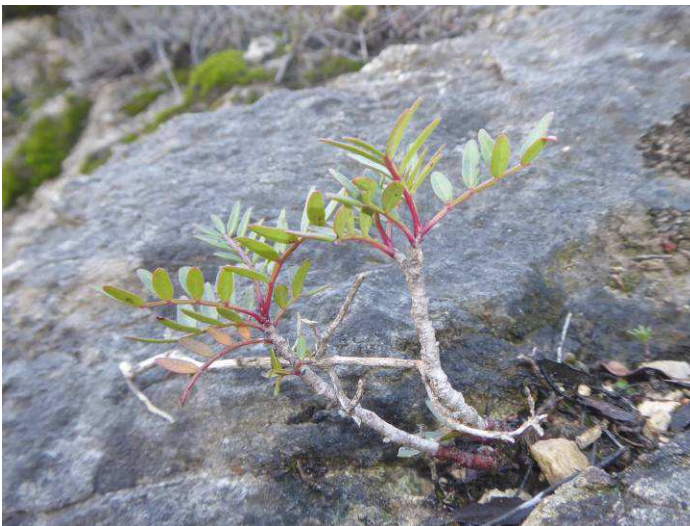
Pistachier lentisque ( Pistacia lentiscus ), jeune pied