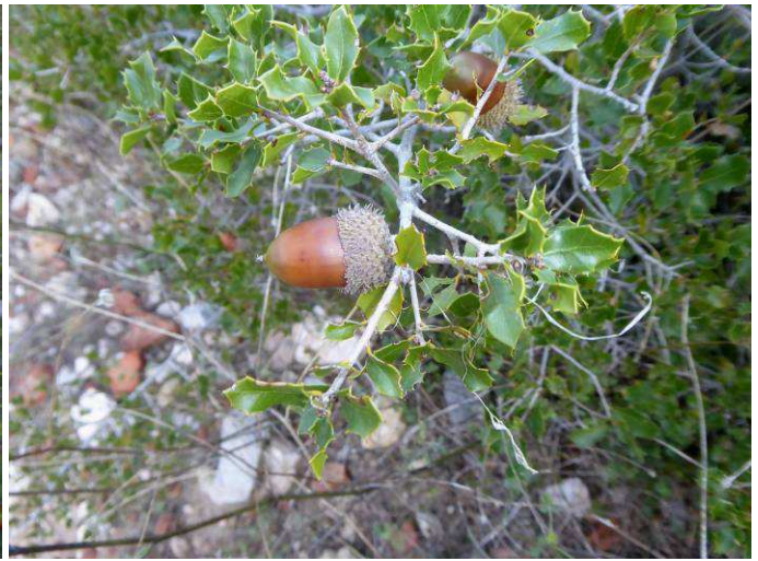
Chêne kermès ( Quercus coccifera )