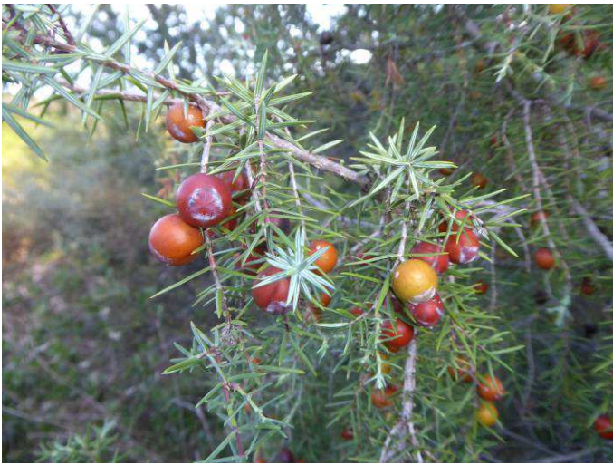
Cade, ou Genévrier oxycède ( Juniperus oxycedrus )