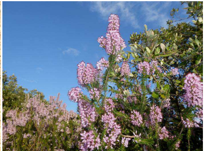
Bruyère multiflora ( Erica multiflora )