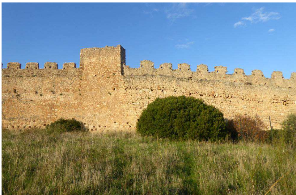
Le Castellat du Barry, au coucher du soleil