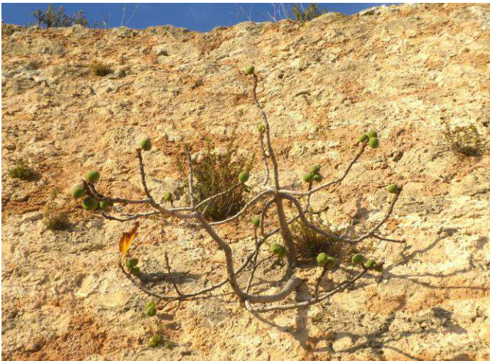
Petit Figuier ( Ficus carica ) accroché à la muraille du Castellás